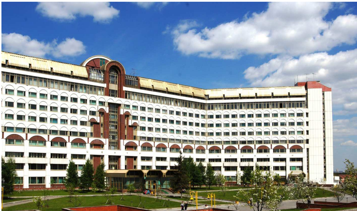
Здание Центра им. А.Н. Бакулева на Рублевском шоссе

ФГБУ «НЦССХ им. А.Н. Бакулева» Минздрава России проводит консультации в рамках территориальных программ государственных гарантий бесплатной медицинской помощи.